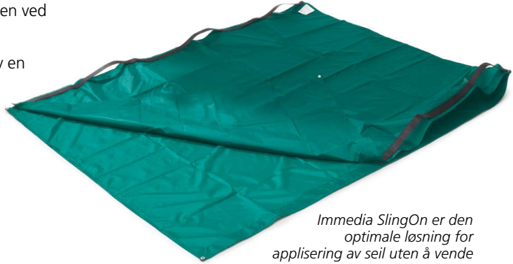
Immedia SlingOn er den optimale løsning for applisering av seil uten å vende brukeren.

SlingOn plasseres under brukeren ved hjelp av en enkel foldeteknikk, enten ved applisering av seil eller for posisjonering. Seilet tres deretter mellom de to lagene av SlingOn.