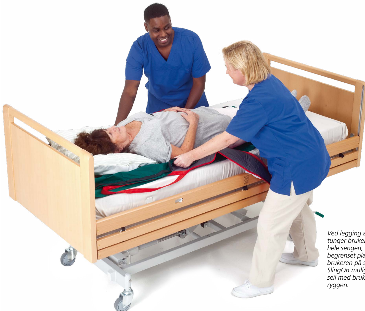
Ved legging av seil på store tunger brukere som fyller ut hele sengen, er det ofte svært begrenset plass til å vende brukeren på siden. Immedia SlingOn muliggjør legging av seil med brukeren liggende på ryggen.