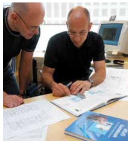
Råd til arkitekter i forbindelse med planlegging av institusjoner