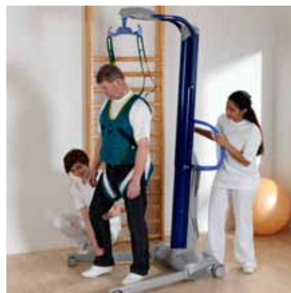
...rehabilitering ved hjelp av den unike gåvesten...