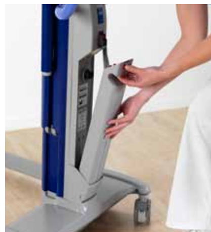
Det er enkelt å skifte batteri.