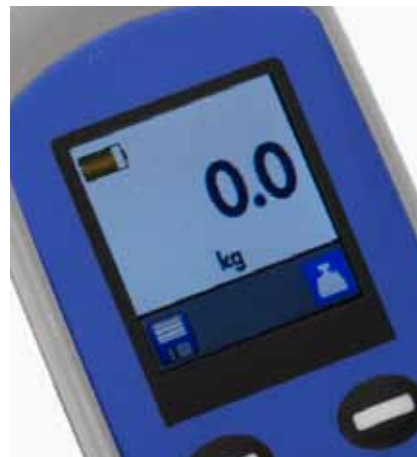
Batterinivået vises tydelig.

Denne nøyte gjennomtestede løfteren er konstruert for å vare, og vil gi sikker og pålitelig, kontinuerlig drift i mange år fremover.