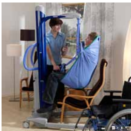
...forflytte pasienter til stoler...