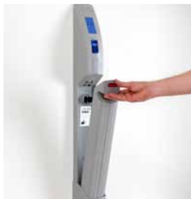
Praktisk veggmontert batterilader.