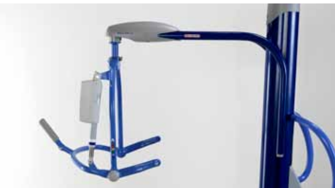
Forlengt løftearm for ekstra rekkevidde.