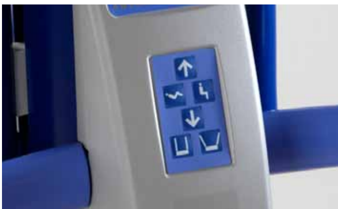
Dobbel betjeningsfunksjon – betjen Maxi Move fra betjeningspanelet på masten eller fra håndkontrollen.