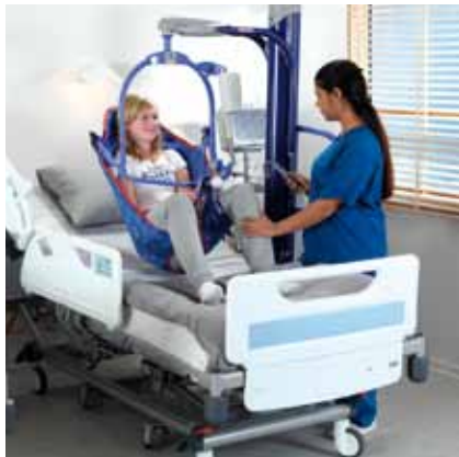
En trygg og enkel måte å plassere pasienter i sengen på...