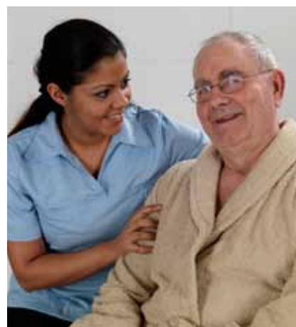
Tottalløsninger med mennesker i fokus