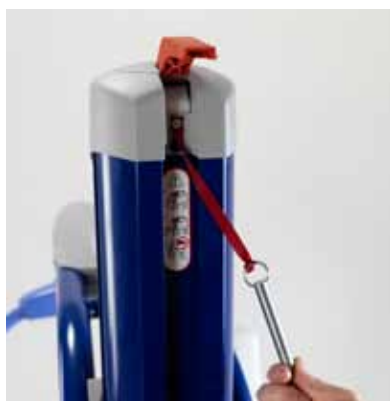
Ved hjelp av nødsenfunksjonen kan pasienten senkes ned uten bruk av verktøy.