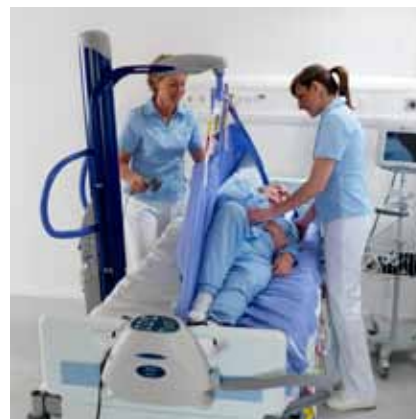
...eller skifte stilling på og snu pasienter i sengen.