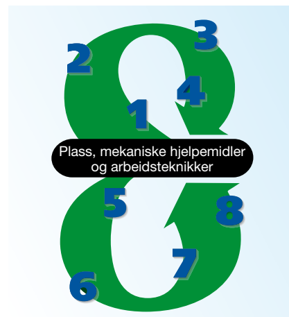
De åtte positive faktorene – en dynamisk modell for kvalitetspleie.

Ved å tilby produkter som dekker beboernes og pasientenes behov kombinert med rådgivningstjenester og opplæring, fungerer ArjoHuntleigh som den perfekte partner når det gjelder å identifisere og etablere et fundament for god kvalitet på pleien.