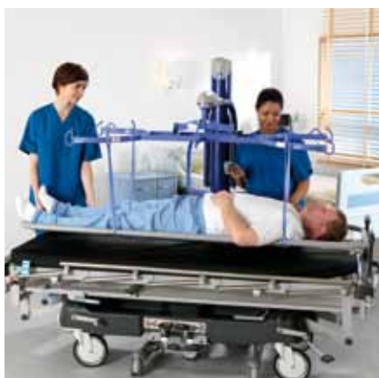
...eller løfte liggende pasienter på bårer.

God stabilitet er grunnleggende for en forsvarlig bruk av løfteren og for at pasienten skal føle seg trygg under forflytninger. Maxi Move bygger på et løfteprinsipp som sikrer meget god stabilitet.