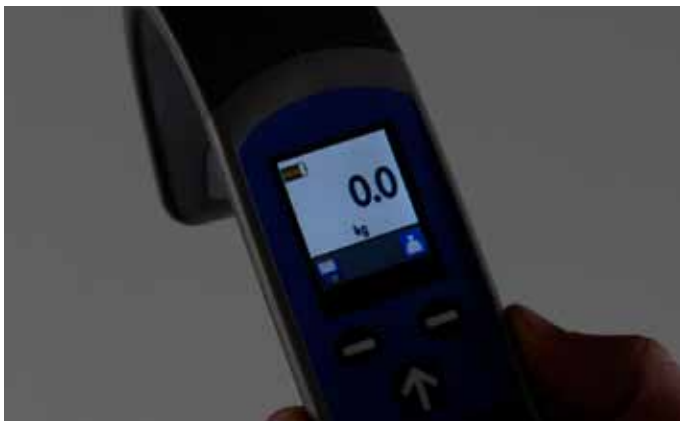
TROL-skjerm med opplyst display.

Håndkontrollen er laget av et usedvanlig holdbart materiale med en innebygd krok som gjør at den kan plasseres på løfteren.