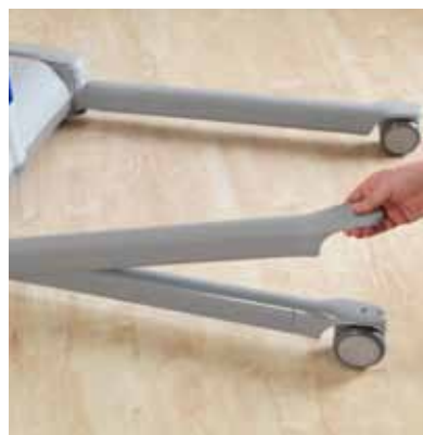
Avtakbare deksler til understellsbena for enkel rengjøring.