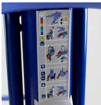
Kortfattet bruksanvisning – alltid der når du trenger den.