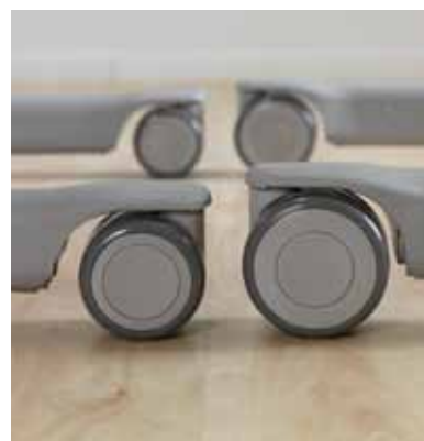
Ekstra lave hjul – for bedre atkomst til sengekanten.