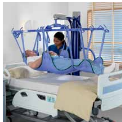
En optimal løsning for løfting av liggende pasienter ved akuttmottak...