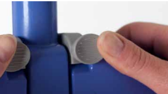
Kombifeste for maksimal fleksibilitet.