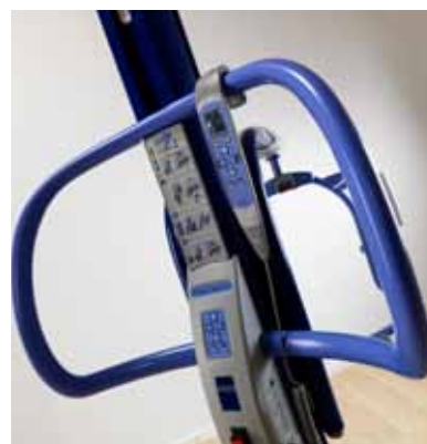
Ergonomiske håndtak gir smidig manøvrering.