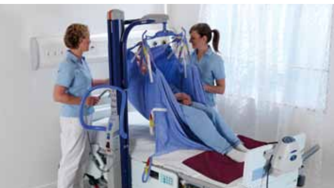
Gjør det enkelt å skifte stilling i sengen, ved hjelp av båreseil.

Kombifestet er en sikker og brukervennlig låsemekanisme for alle passive løftere fra ArjoHuntleigh, som gjør det enkelt å skifte mellom de fleste typer løftebøyler og bærer som finnes på markedet.