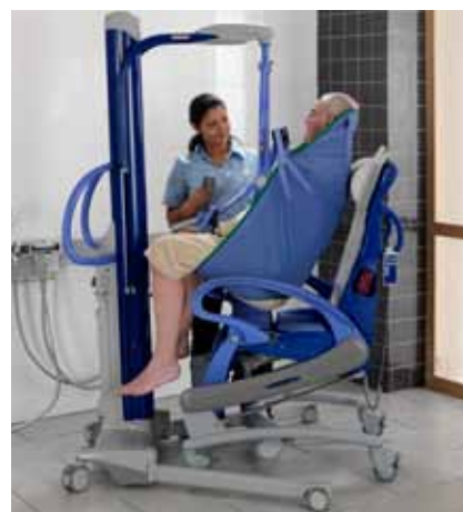
Maxi Move passer godt sammen med Carendo.