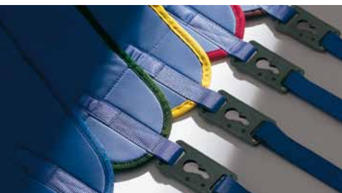
Seil for individuelle behov.