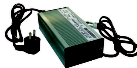
Batterilader for Litium Ion-batterier