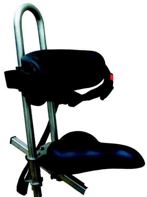
Ryggstøtte med belte