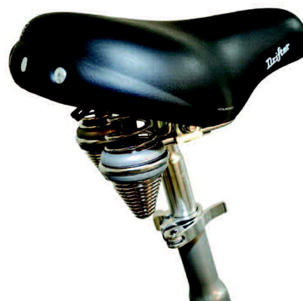
Enkel høydejustering av setene

Hvis du har brukere med sterkere grad nedsatt funksjon og dårlige balanse, kan tandemsykkel med tre hjul være mer funksjonelt enn med to hjul. Med Twinnny Plus opprettholdes balansen både ved lav hastighet og start og stopp. På tross av at Twinnny Plus er en 3-hjuls tandemsykkel påvirker dette kun bredden minimalt, da den bare er 9 cm bredere en Twinnny 2-hjul.