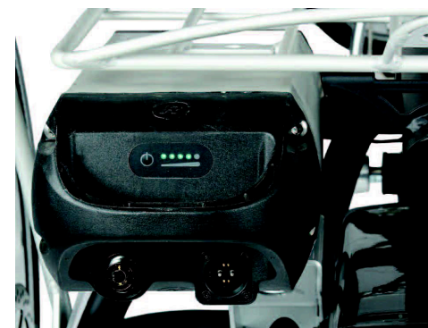
Litium Ion-batterier Tilgjengelig i både 36 V 11 Ah og 36V 25 Ah.

Sovemodus: Batteriet vil, hvis det ikke er brukt på noen dager, gå over i sovemodus for å spare batteriene. For å «vekke» batteriene så kan man enten sette inn ladekontakten eller man kan sykle noen tråkk og samtidig holde inne startknappen på displayet. Displayet på cockpiten vil da lyse opp og hjelpemotoren vil fungere. I tillegg er det en av/på-knapp som «vekker» batteriet når det er i dvalemodus.