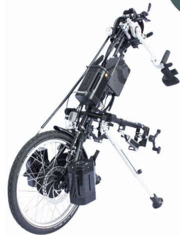
Lipo Smart Tetra