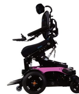
Aktiv tilt 15°