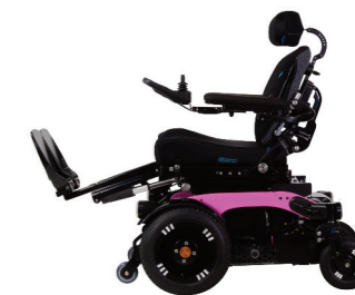
El. regulerbar benstøtte med glidefunksjon