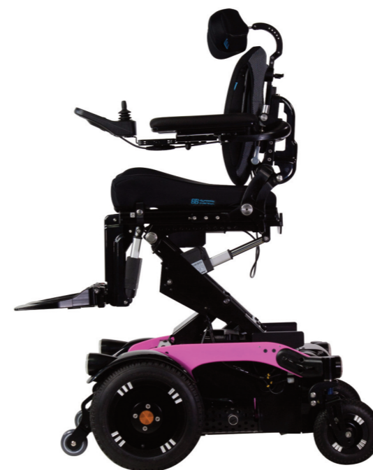
Seteløft 30 cm