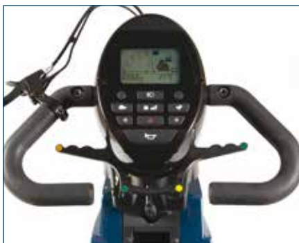
Kontrollpanelet er oversiktlig med et klart LCD-vindu og enkle knapper.