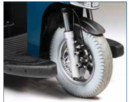
Fjæringen foran har meget god støtdempende effekt. Skivebremses foran.