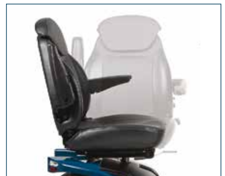
Et justerbart og komfortabelt sete med god korsryggstøtte. Setet har 360° rotasjon og reguleres frem-/bakover på glideskinne.