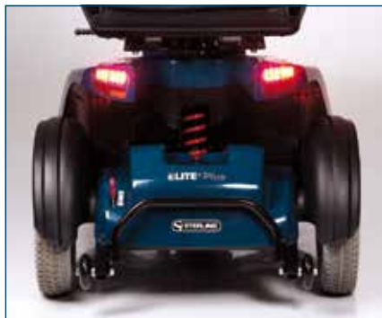
Hydraulisk justerbar fjæring bak, frihjuls-mekanisme og tippesikringshjul.