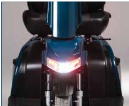
CE merket LED lys; foran og bak, blinklys og bremselys.

Det finnes flere tilbehørsvalg som kan gjøre scooteren bedre tilpasset dine behov. Som standard er den utstyrt med 2 speil og en krykkeholder i tillegg til kurv foran. Du kan også få presenning, rollatorholder, oksygenflaskeholdere, bagasjeboks, kurv bak og hjul med piggelekk.