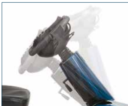
Enkelt regulerbart styre for tilpasning til beste posisjon for deg.