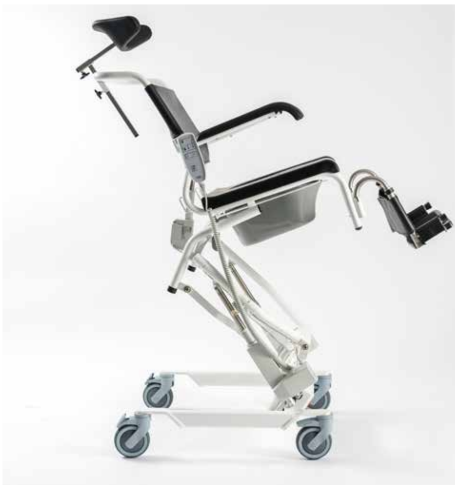
Bildet viser ERGOtip 5. ERGOtip 5 og 6 har formstøpt sete og de øvrige har polstret sete.

Økt selvstendighet og bedre arbeidsmiljø for hjelper - det er det du kan regne med når ERGOtip dusj- og toalettstol kommer i hus. Samtidig får personen i stolen og hjelper bedre kontakt i øyehøyde.