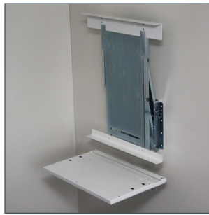
Bredde fra og med 50 cm til og med 120 cm