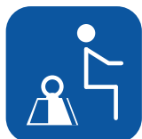
Maks. brukervekt ▼