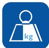
Total vekt ▼