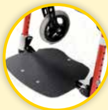
Hel oppfellbar fotplate.