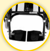
Fotplate; separate. Svingbare ut eller inn.