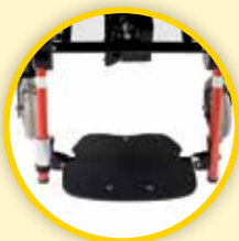
Fotplate; hel og fast.