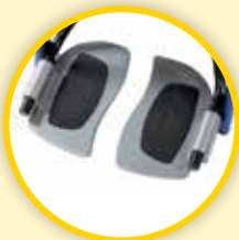
Fotplate; separate og oppfellbare.