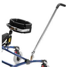
Ledsagerhåndtak (Kan monteres på begge sider)