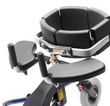
Armstøtte med håndtak