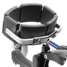
Bryststøtte (Standard prisforhandlet tilbehør)