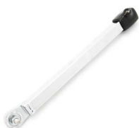
Stangsystem til hodestøtte