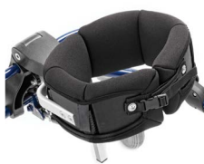
Trekk til bryststøtte