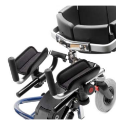
Underarmstøtte med håndtak