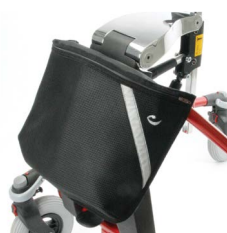
Oppbevaringsveske til str. 3+4