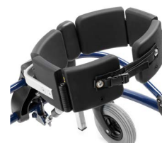
Mellomstykke til bryststøtte