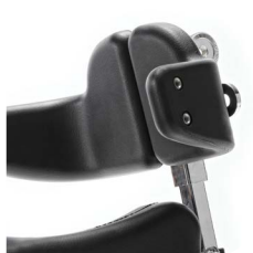
Hoftestøtte, med beslag til hodestøtte