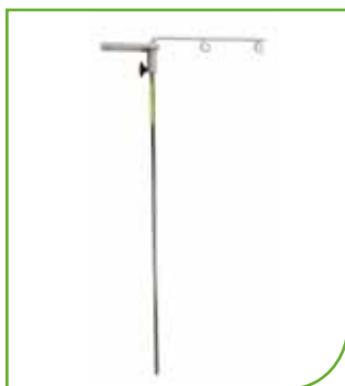
Infusjonsstativ Art. nr. 107-710858