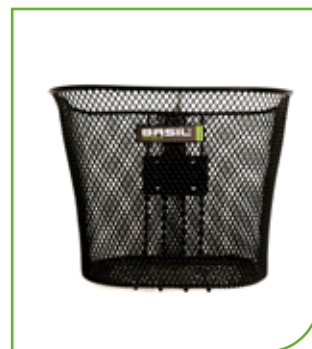
Kurv Art. nr. 107-710859