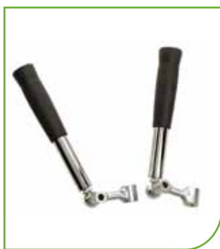
Håndtak, leddet Art. nr. 107-710855