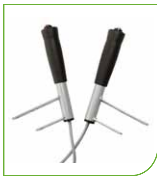
Håndtak med el-kontroll Art. nr. 107-710863