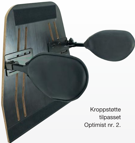
Kroppstøtte tilpasset Optimist nr. 2.