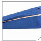
Inkontinensstrekket har overdekket glidelås