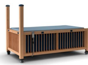
LEA sprosser m/avtagbare sengestolper