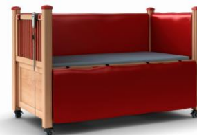
LEA sprosser med polster 60 cm