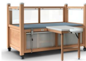
LEA plexi m/terapibord m/hodestøtte