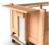
Hylle ved hodeenden