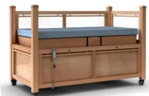
LEA plexi m/hevet liggeflate