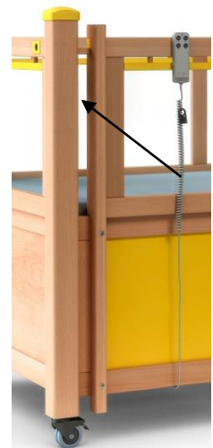
Utsparing for slanger dør 1 og 4