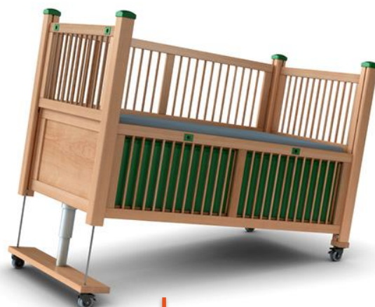
LEA sprosser m/anti-Trendelenburg