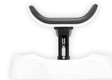
Trinnløs justering, høyeste mulighet