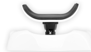
Trinnløs justering, laveste mulighet