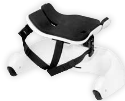
Standard utstyrt Krabat Pilot