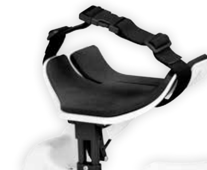
Reim over rygg