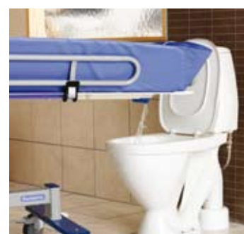
Fleksibel avløpsslange, tapper ut vannet i et toalett eller avløp i gulvet