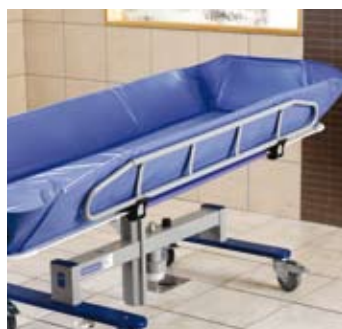
Ekstra høye sidegrinder