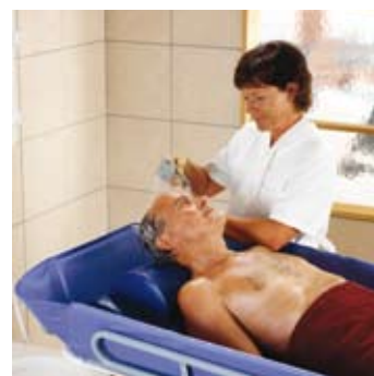
Concerto er en perfekt plattform for ergonomiske hygienerutiner som for eksempel hårvask.

Concerto inngår i den omfattende dusjserien til ArjoHuntleigh. Med Concerto , Carendo og Carino sørger ArjoHuntleigh for at pleieinstitusjonene kan tilby optimale dusjløsninger for beboere og pasienter av alle mobilitetsgrader.