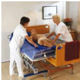
MaxiSlide glidelakener sørger for sikker, ergonomisk sideveis forflytning.