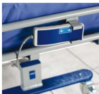
Holder til håndkontroll, bare elektrisk modell