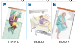
EMMA EMMA EMMA

Eldre-omsorg Akutt-omsorg Spesial-omsorg