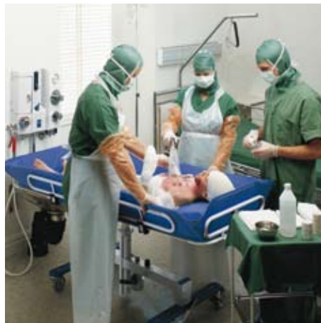
Den myke madrassen gjør det så behagelig som mulig for pasienten under hygienerutinene før operasjonen.

En mobil løsning kan være spesielt nyttig i forbindelse med akutthjelp. Concerto kan raskt flyttes dit hvor det er behov for den. Dusjvognen, som også kan fungere som stellebord, fås i tre forskjellige lengder. Dermed passer den til både voksne og barn i forbindelse med akutthjelp.