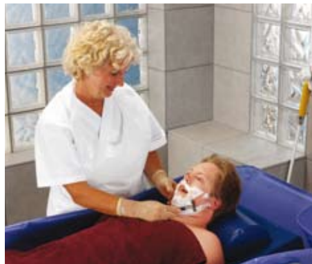
Concerto gjør det mulig å gi ekstra pleie gjennom å tilby en plattform for rutiner som beboeren ikke klarer å utføre selv, for eksempel barbering.