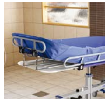
Regulerbar ryggstøtte med tre stillinger