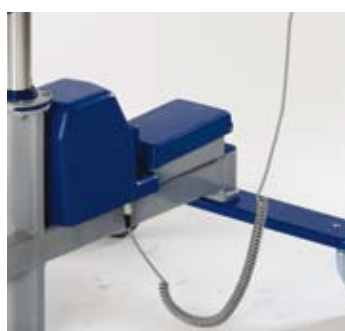
Elektrisk modell, batteridrevet