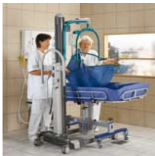
Enkel og sikker forflytning til Concerto ved hjelp av en løfter med seil.