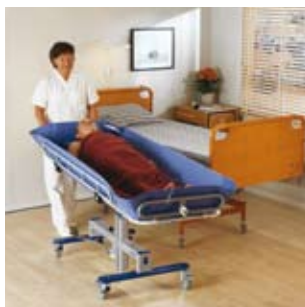
Smidig transport med retningssperre for korridorer.