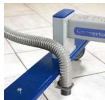
Holder til avløpsslange