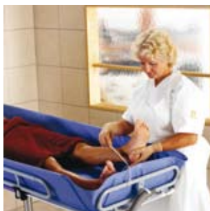
Regelmessig fotpleie kan utføres enkelt og effektivt.