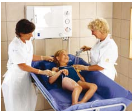
Sikker dusjing er viktig for beboere som er utsatt for anfall. De ekstra høye sidegrindene, som er å få som ekstrautstyr, kan være nyttige til beboere i risikogruppen.

Spesialinstitusjoner omfatter en rekke pleiemiljøer hvor beboerne er hjelpetrequende som følge av mentale eller fysiske funksjonshemninger. Ettersom Concerto er å få i tre forskjellige lengder, kan den brukes til både barn og voksne i forbindelse med dusj- og hygienerutiner.