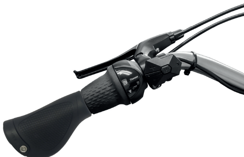
Figure 5: Gir, type Grip-shif

Når du dreier mot -, får du et lavere gir og sykkelen går letter å trå