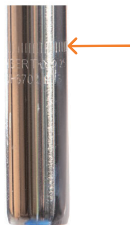
Figur 2: Høydemerking