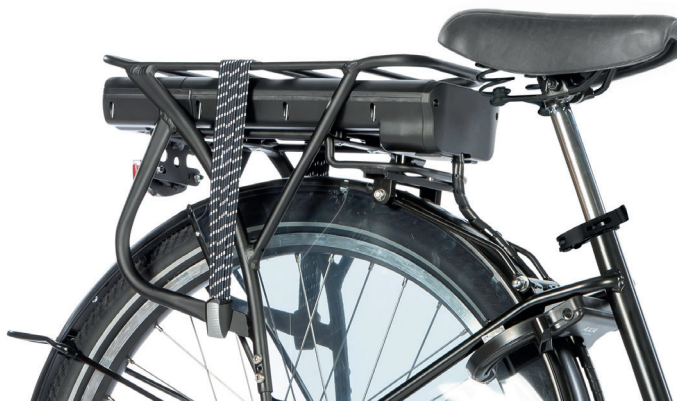
Figur 7: Bagasjebærer

13. Bagasjebærer Bagasjebæreren kan brukes til små vesker eller andre gjenstander (figur 7). Lasten på bagasjebæreren bør ikke være mer enn 10 kg.