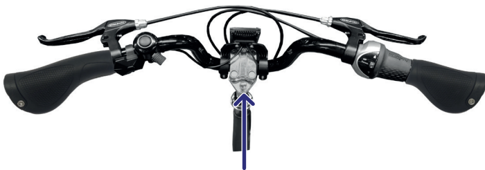
Figur 3: Løsne bolten med en umbrakonøkkel

Merk: Sikkerhetsmerkingen på styret skal ikke være synlig når styret er i styrerøret (Figur 4).