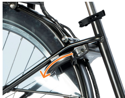
Figur 6: Ringlås

Easy og Lowy 16" har en kabellås i stedet for en ringlås. Denne er plassert på bagasjebæreren. Den fungerer på samme måte som ringlåsen.