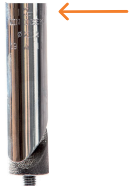
Figure 4: Høydemerking