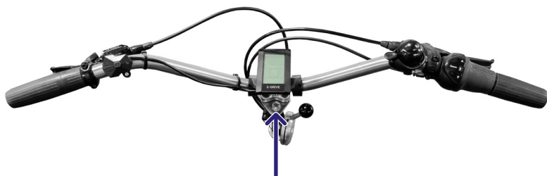
Figur 5: Løsne bolten med en umbrakonøkkel

Merk: Sikkerhetsmerkingen på styret skal ikke være synlig når styret er i styrerøret (figur 6).