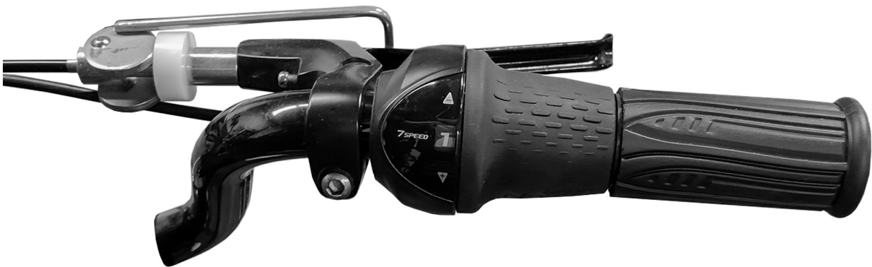
Figur 7: Gir, type Grip-shift

Når du vrir mot +, får du et høyere gir og sykkelen går forter. Når du dreier mot -, får du et lavere gir og sykkelen går letter å trå