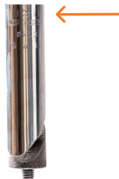
Figur 6: Høydemerking