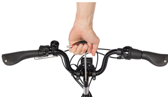
Figur 4: Løsne bolten med en umbrakonøkkel

Merk: Sikkerhetsmerkingen på styret må ikke være synlig når styret er i styrerøret (Figur 5).