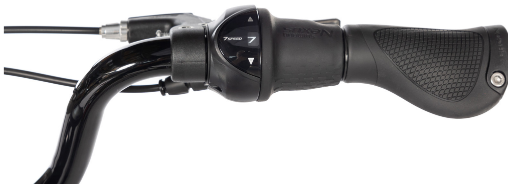
Figur 6: Gir, type Grip-shif

Når du vrir mot +, får du et høyere gir og sykkelen går forter. Når du dreier mot -, får du et lavere gir og sykkelen går letter å trå