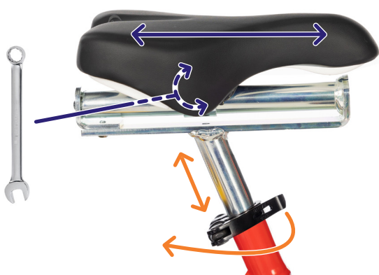
Figur 2: Justeringssystem for sete

Merk: Sikkerhetsmerkingen på setepinnen må ikke være synlig når setet er i seterøret. (figur 3).