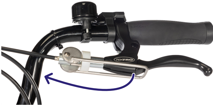
Figur 1: Du kan (de-)aktivere parkeringsbremsen ved å bevege denne spaken.

Så snart parkeringsbremsen treffer bremsespaken, aktiveres bremsen (figur 1).