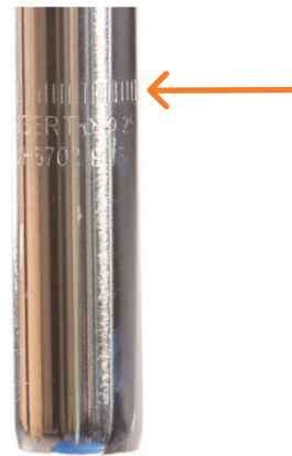
Figur 3: Høydemerking