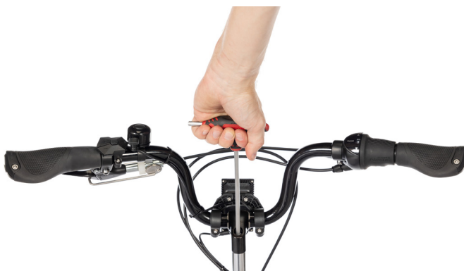
Figure 4: Loosen the bolt with a wrench

Merk: Sikkerhetsmerkingen på styret må ikke være synlig når styret er i styrerøret (Figur 5).