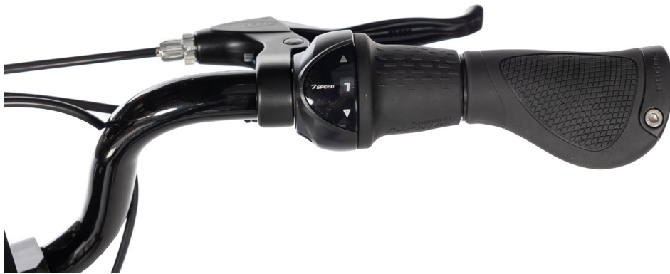
Figur 6: Gir, type Grip-shif

Når du vrir mot +, får du et høyere gir og sykkelen går forter. Når du dreier mot -, får du et lavere gir og sykkelen går letter å trå