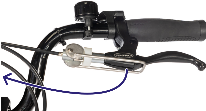
Figur 1: Du kan (de-)aktivere parkeringsbremsen ved å bevege denne spaken.

Så snart parkeringsbremsen treffer bremsespaken, aktiveres bremsen (figur 1).