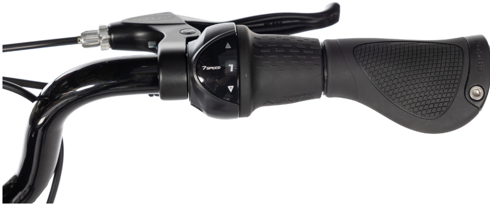
Figur 6: Gir, type Grip-shif

Når du vrir mot +, får du et høyere gir og sykkelen går forter. Når du dreier mot -, får du et lavere gir og sykkelen går letter å trå