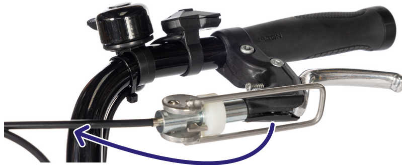
Figur 1: Du kan (de-)aktivere parkeringsbremsen ved å bevege denne spaken.

Så snart parkeringsbremsen treffer bremsespaken, aktiveres bremsen (figur 1).