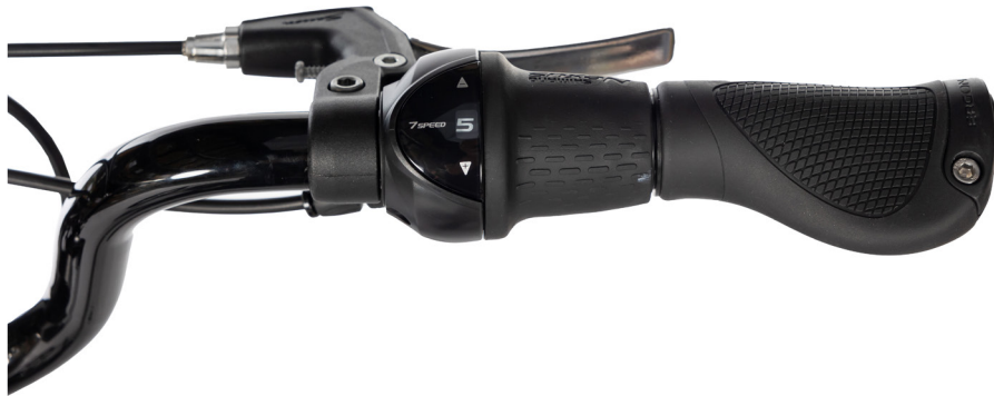
Figur 6: Gir, type Grip-shif

Når du vrir mot +, får du et høyere gir og sykkelen går forter. Når du dreier mot -, får du et lavere gir og sykkelen går letter å trå