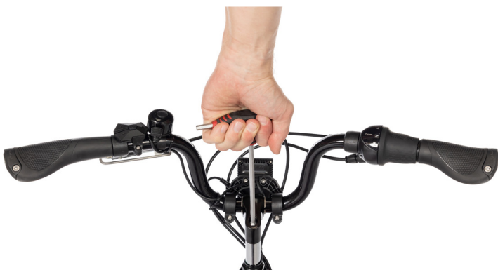
Figur 4: Løsne bolten med en umbrakonøkkel

Merk: Sikkerhetsmerkingen på styret må ikke være synlig når styret er i styrerøret (Figur 5).