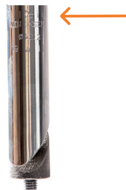
Figur 5: Høydemerking