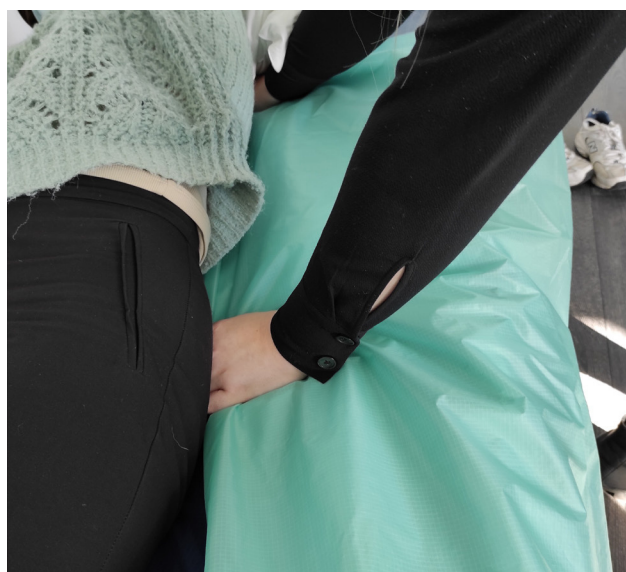
4. Skyv hendene til midten av personens kropp.