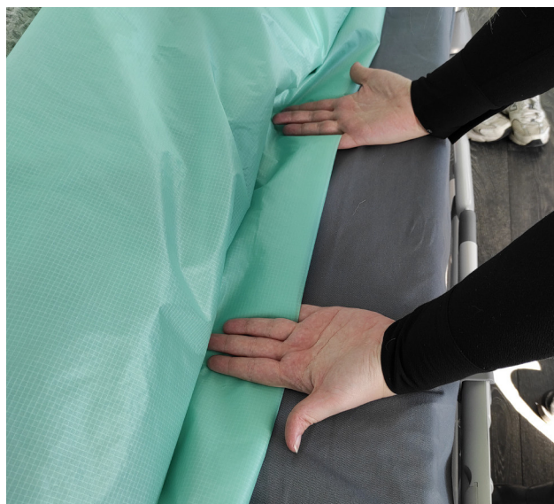
Til forflytninger: Helt inn under kroppen

Uansett hvilken metode som brukes, er prinsippene de samme: