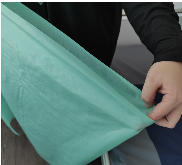
1. Brett forflytningsduken på midten