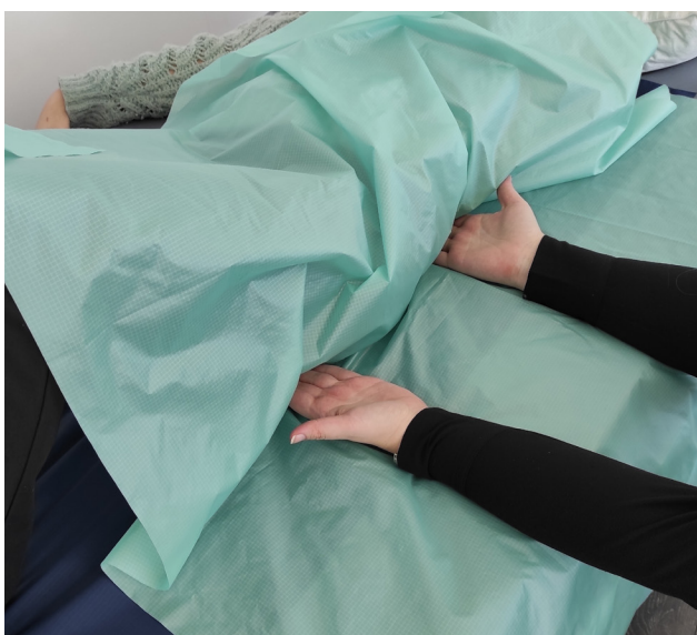
3. Plasser hendene inni folden med håndflatene vendt opp og nær hver side av bakkdelen (personens tyngdepunkt). Derved blir hendene inn der det er minst vekt.

Fest forflytningsduken ved å holde i duken mens foldebretten skyves noen centimeter inn mellom madrassen og kroppen.