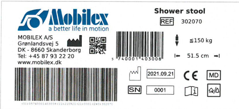
Billede af typeskiltet Badebænk 302070

Typeskiltet befinder sig på bagsiden af Badebænken og oplyser bl.a. max. brugervægt.