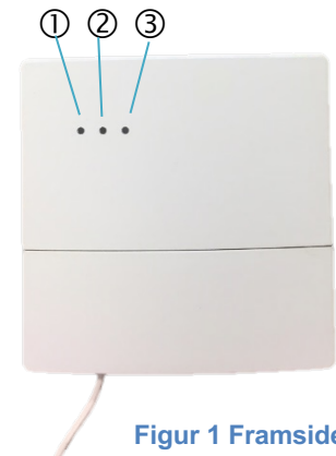
Figur 1 Framsiden