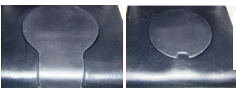
Setelukk, åpen front Setelukk, lukket front