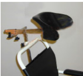
Nakkestøtte, tilbehør høyderegulerbar, dybderegulerbar og sideveis regulerbar