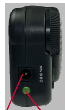
LED-indikator for lading