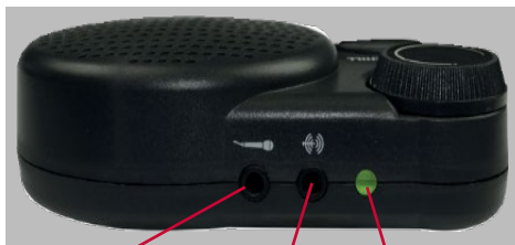
Mikrofoninngang Lydutgang LED-indikator Ladeport