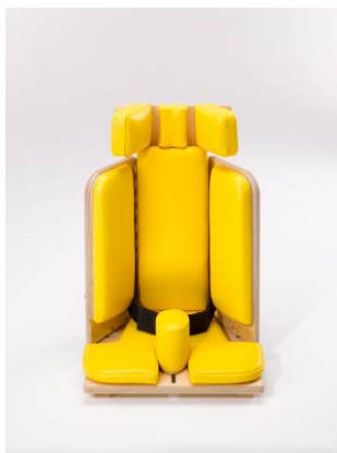
Hjørnestol innstilt til minimum

Hodestøtten kan reguleres i høyde og bredde og hver av sidestøttene i hodestøtten kan roteres(Fig.4) Høyden på hodestøtten reguleres ved å løsne de to umbracoskruene som sitter i sporet på baksiden av ryggen. Du regulerer opp ryggen og hodestøtten følger med (Fig.4). Bredde og rotasjon av den enkelte sidestøtten på hodestøtten reguleres ved å løsne skruerattet (D).