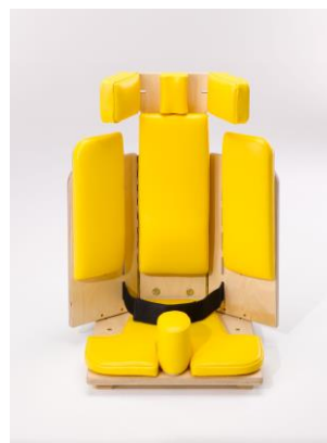
Hjørnestol innstilt til maximum